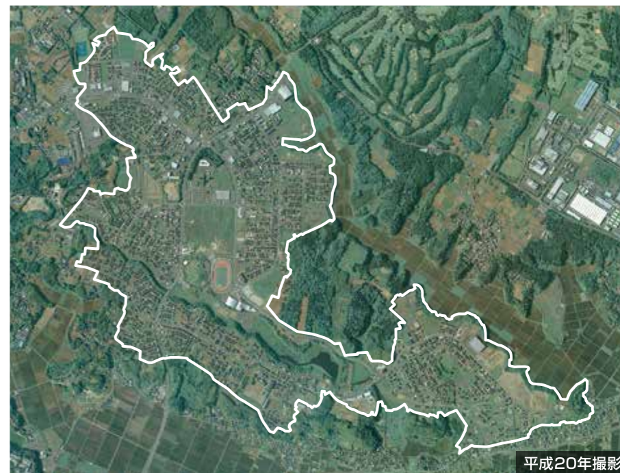
平成20年撮影