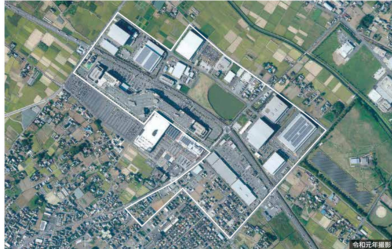
出典: 国土地理院ウェブサイト ( https://www.gsi.go.jp/tizu-kutyu.html )

菖蒲北部地区は、埼玉県久喜市菖蒲地区の市街地の北東部に位置しています。周辺が水田に囲まれた平坦地で、埼玉県北東部地域の新たな産業拠点として、久喜市の産業振興及び都市的発展に資することを目標として、土地区画整理事業により整備されました。地区中央を通る国道122号バイパス沿線を中心に、ショッピングモールや物流施設などが立地しています。