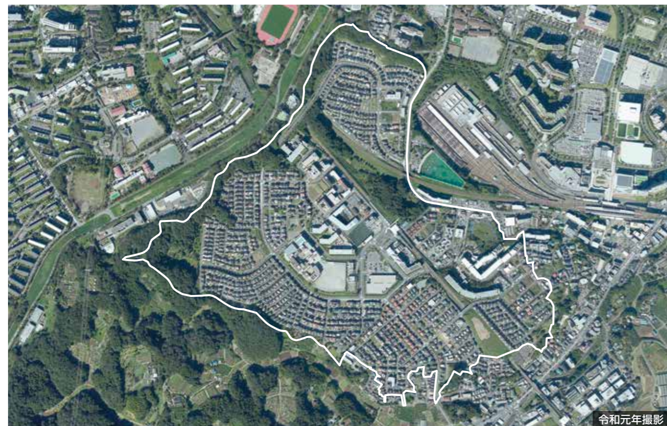
令和元年撮影

多摩ニュータウンの南側、川崎市麻生区の北端に位置する黒川はるひ野地区は、豊かな自然と環境に配慮し、健全かつ良好な市街地の形成を目的として、事業が行なわれました。地区の特徴である丘陵や谷戸、ため池などの従来からの自然を生かした公園や、日常的に自然に親しめる緑の空間、せせらぎのある歩行者専用道路等の整備を行いました。また、事業の進捗に併せ小田急多摩線はるひ野駅が開業。緑と住まいの景観を創り出すため、まちなみ協定を定め、美しい住環境の維持にも努めました。