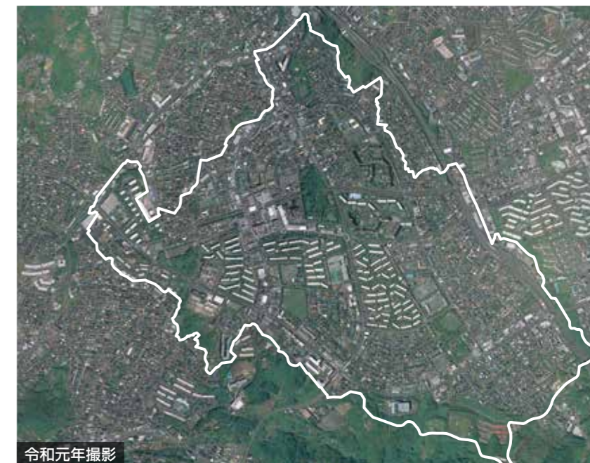
令和元年撮影