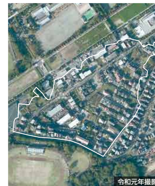
令和元年撮影