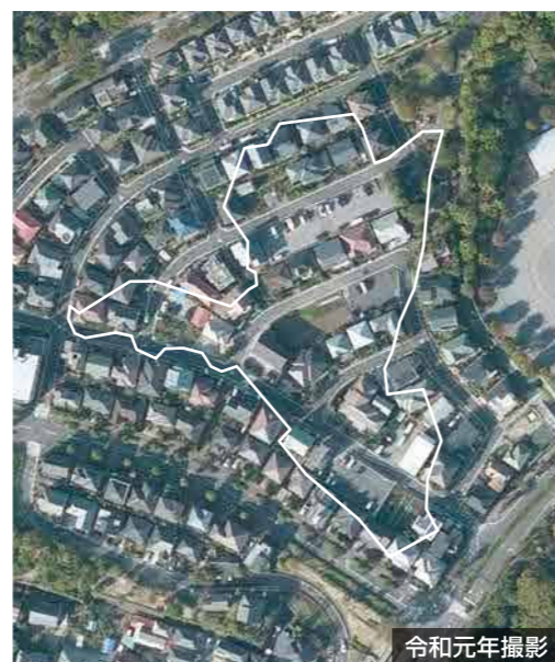
令和元年撮影