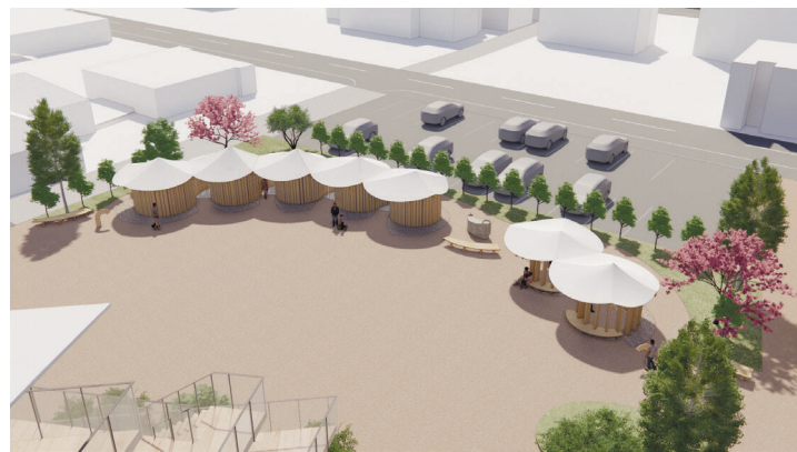
＜公共トイレ・東屋＞