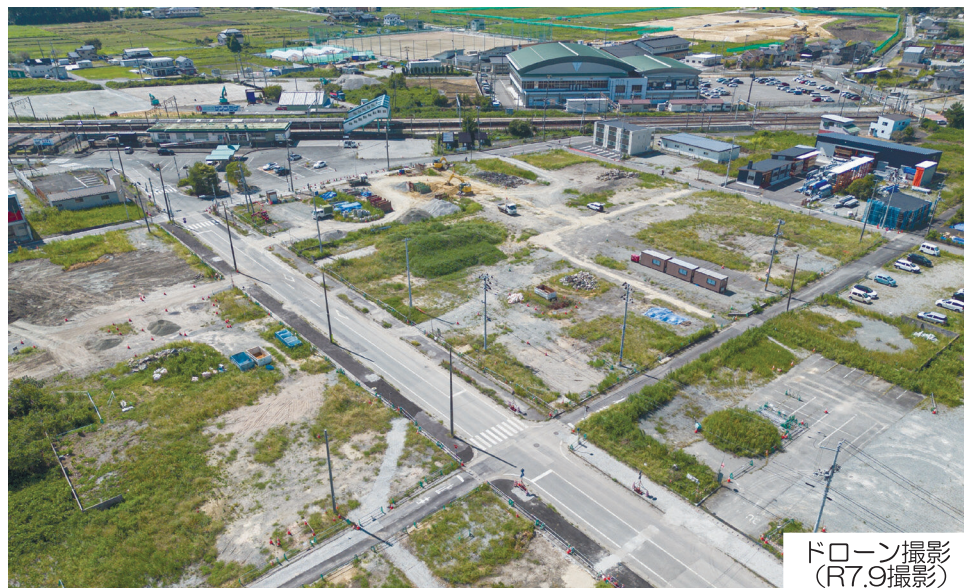
ドローン撮影 (R7.9撮影)