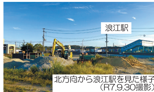
浪江駅 北方向から浪江駅を見た様子 (R7.9.30撮影)