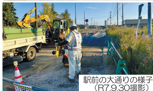
駅前の大通りの様子 (R7.9.30撮影)