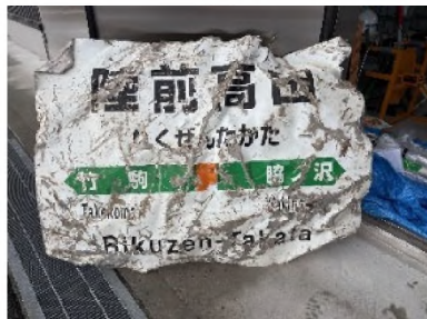
津波被害の甚大さが伺える駅看板（陸前高田市）