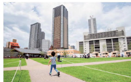
としまどりの防災公園（IKE・SUNPARK）（豊島区）