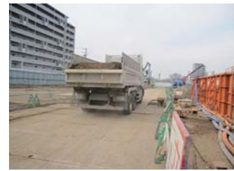
・残土処分(搬出)開始 (〇月〇日)