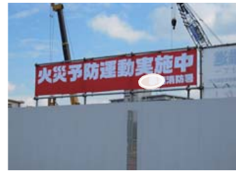
・火災予防週間 (〇月〇日～〇月〇日)