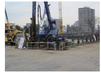
・山留め工事 (〇月〇日)