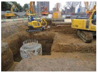
・根切工事(掘削)開始 (〇月〇日)