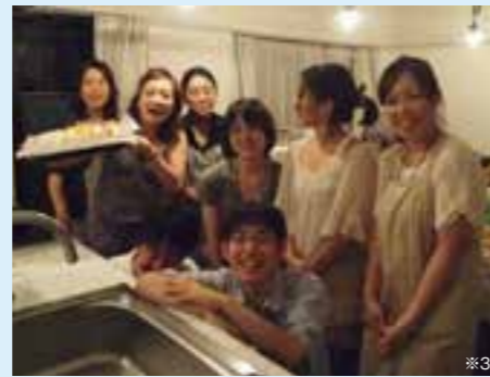
入居者が集まり、1階にある大型キッチンで料理をしてパーティーを開くなど、シェアハウスならではの交流がある