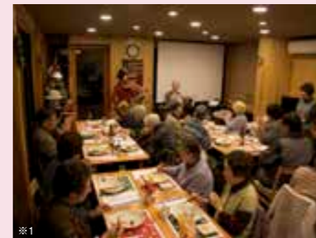
建物に併設された「ゆいま〜る食堂」は住民の憩いの場。入居者のクリスマスパーティーやお茶会なども開催される