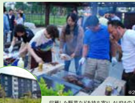
収穫した野菜などを持ち寄り、AURAの入居者はもちろん他の棟の住民も参加してパーベキューなどを楽しむイベントを開催した