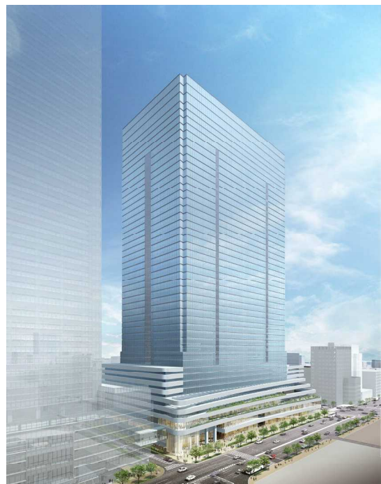
外観イメージパース(東京駅八重洲口側)

今後も、国際都市・東京の中核となる東京駅前における都市再生ならびにSDGsに貢献する100年後を見据えたサステナブルな街づくりの実現に向け、本事業を推進してまいります。