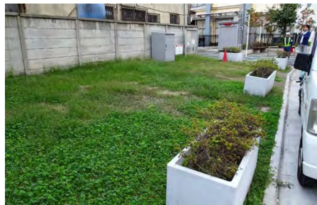
不燃化促進用地（道路拡幅や老朽建物除却による空地を一定期間URが保有、区が管理し、住民が利用ルールを決定）