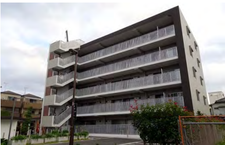
従前居住者用賃貸住宅コンフォール町屋（約900㎡、27戸が不燃化特区「荒川二・四・七丁目地区」のコア事業の一つとして都営住宅の跡地に整備された）