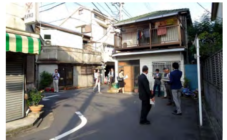
整備予定の主要生活道路3号線（見通しの悪いクランクを解消して衝突事故を回避し、道幅も4mから6mに拡幅される）