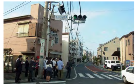
特定整備路線（1.2kmにわたり25m（現在4～11m）に拡幅され、沿道の緑道整備と耐火建築への建替え促進により延焼遮断帯としての機能も合わせ持つ）