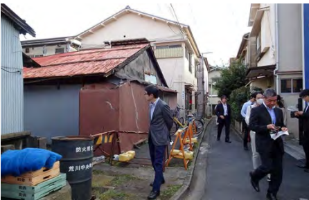
昭和初期木造長屋の空き家と細街路 （戦前から残る細街路や木造住宅がエリア内に点在している）