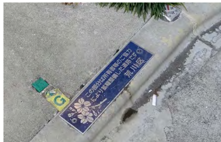
道路拡幅整備を示すステッカー（主要生活道路整備事業により拡幅した場所に貼られた周知ステッカー。多くの方の協力によりまちの安全が図られている）