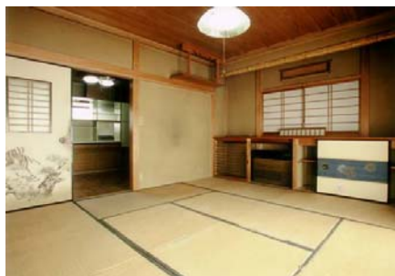
リニューアル前 (築23年・純和風の注文住宅)