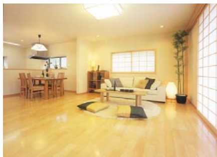
リニューアル後(モダンジャパニーズ)

ア・ラ・イエとは、街並みを守りながら沿線価値の維持向上を目的とした、沿線にお住まいの方の住み替え・建て替え・リノベーションのお手伝いをするシステムで、住まいを新しくしたり、改めることによって、住んでいる方、購入している方の生活を支えることを目標にしている。