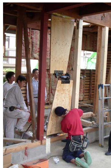
構造面でも耐震補強を行い、 耐震基準適合証明書を取得 (写真は制震装置による補強)