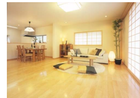
リニューアル後(モダンジャパニーズ)

ア・ラ・イエとは、街並みを守りながら沿線価値の維持向上を目的とした、沿線にお住まいの方の住み替え・建て替え・リノベーションのお手伝いをするシステムで、住まいを新しくしたり、改めることによって、住んでいる方、購入している方の生活を支えることを目標にしている。