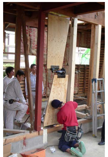
構造面でも耐震補強を行い、 耐震基準適合証明書を取得 (写真は制震装置による補強)