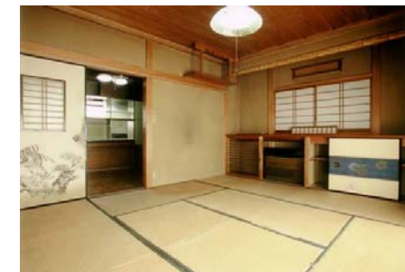
リニューアル前 (築23年・純和風の注文住宅)