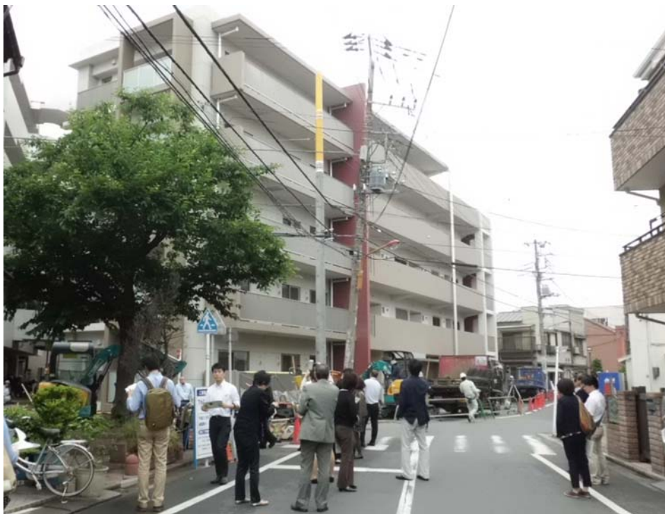
見学の様子（背後の建物が防災街区整備事業による防災施設建築物）