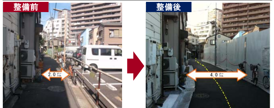
区画道路1号の拡幅整備