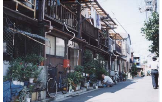
大正から昭和初期の長屋が現存する京島地区