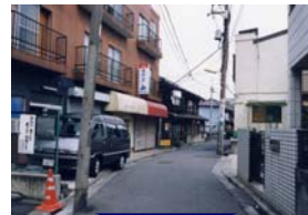
(左)道路拡幅整備状況