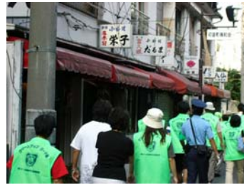
防犯パトロールの様子