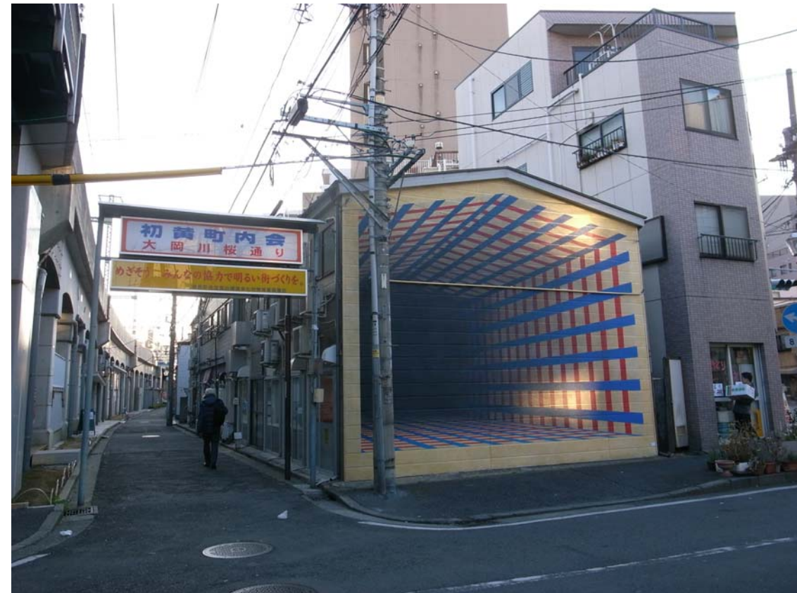
黄金町 まちかどのアート作品(吉野もも「町の隙間」)