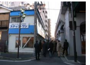
見学の様子 (防犯拠点 ステップ・ワン)