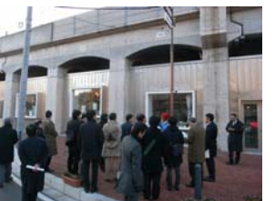
見学の様子 (黄金スタジオ)