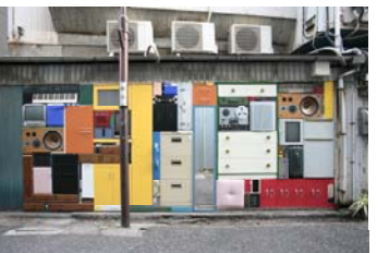
黄金町バザール2012 出展作品 マイケル・ヨハンソン 「Recollecting Koganecho」