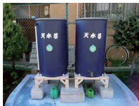
天水尊(家庭用雨水貯留槽)