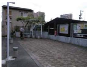
5 はとほっと(路地尊第5号)