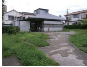
6 一寺言問広場・集会所