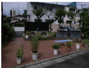
4 会古路地(路地尊第4号)