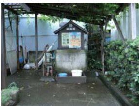
3 有季園(路地尊第3号)