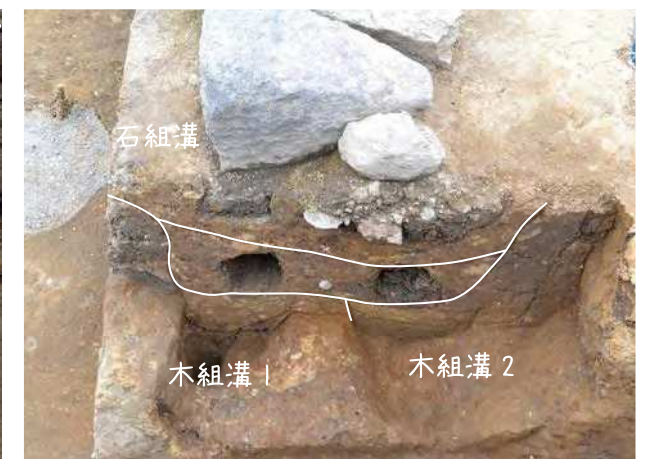
側溝(排水溝)付近の地層

貝殻混じりの砂利、砂やローム土で何度も改修や整地が行われた結果、厚さ50-60cm程かさあげされていました。