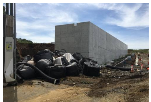
台風後現場状況写真

<緊急連絡先> UR工事監督員事務所 TEL : 0120-332-077 080-1036-0238 (事務所常備)