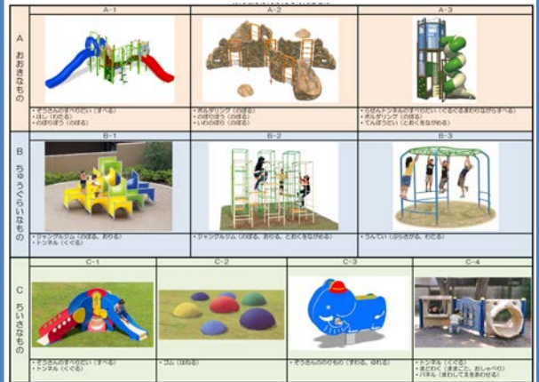
子どもたちのアイデアを基にした遊具の候補リスト

東台小学校の生徒の皆様、ゾウさん広場の遊具のアイデア出しと選定にご協力いただきました。この作業には全校生徒にご参加いただきました。また、近隣のセンター保育園と三松幼稚園の児童の皆様にもご参加いただきました。その後、市とURで遊具の配置等を検討した結果、子どもたちに提示した遊具をほぼ全部設置できることになりました。