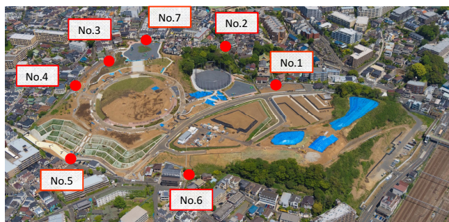
● 騒音・振動計設置位置