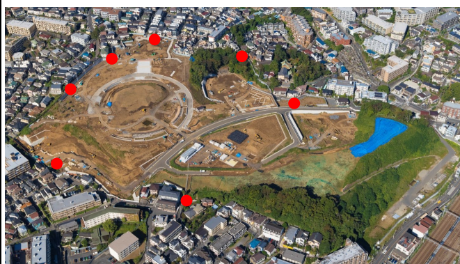
● 振動・騒音計設置位置