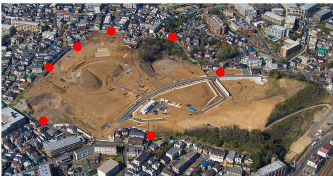
● 振動・騒音計設置位置