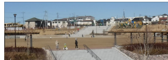
毎日多くの方々にご利用いただいています。

事業区域内においては、引き続き複数の工事を行ってまいります。 地域の皆様には、今後ともご不便、ご迷惑をおかけいたしますが、安全第一に早期完了を目指して進めてまいりますので、ご理解、ご協力をよろしくお願いいたします。