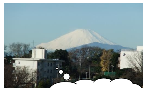
天気がいいと富士山も一望できます