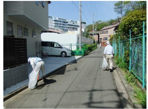
毎週月曜日の清掃活動

昨年の1年を通してスタンド等屋外施設の上物撤去が完了しました。建物基礎及び杭の撤去工事は昨年に引き続き継続しております。地域の皆さまには何かとご不便をおかけしますが、今年も何卒よろしくお願い申し上げます。