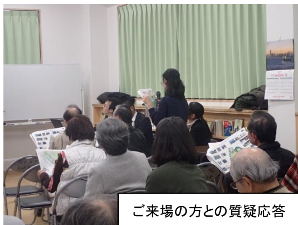
ご来場の方との質疑応答