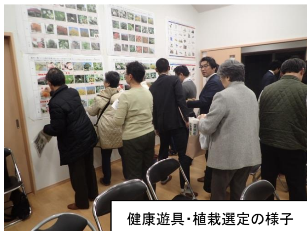
健康遊具・植栽選定の様子