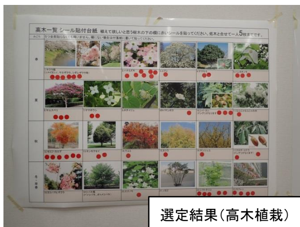
選定結果(高木植栽)

今後の意見交換会の日程は、以下になっておりますので、是非ご参加いただきますようお願いいたします。(詳しくは回覧中のお知らせでご確認ください。)