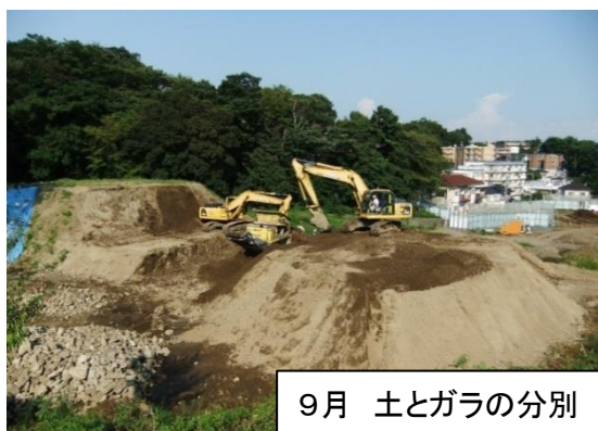
9月 土とガラの分別