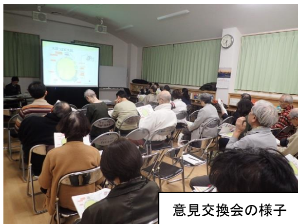
意見交換会の様子