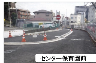
センター保育園前

このため、バス通り~八幡前二見台線区間(下図のピンク部分)は、年内に完了する見通しですが、センター保育園~東側道路区間(下図の黄色部分)は、年明けから本格着手し、2月完了に向けて工事を進めていくことになりました。地元の皆様には大変ご不便をお掛けしますが、早期完了に向けて取り組みますので、ご理解、ご協力の程よろしく申し上げます。