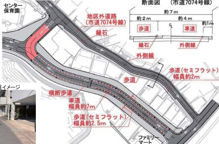
セミフラット歩道イメージ

なお、近接する鶴見1・2丁目内会館には事前に役員会の場をお借りして、ご説明をさせていただきます。