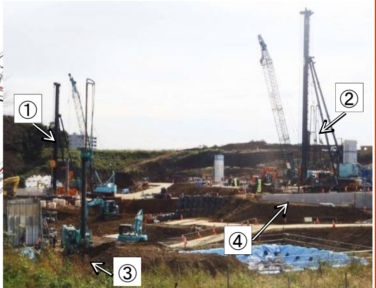
①②基礎杭の打ち込み ③地盤改良 ④12m道路と公園1の境になる擁壁の施工