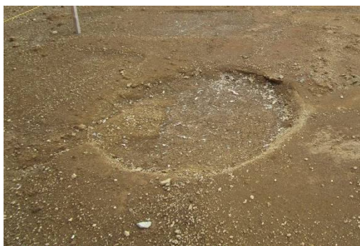
施工不良の状況（基礎杭跡の沈下）

また、この対策工事を進めるにあたって、宅地1のエリアが施工ヤードとなるため、当初12月着工とお知らせしていた、駅前のスロープ工事を延期することになりました。