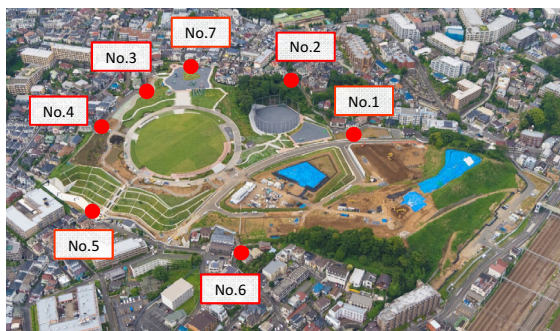
● 騒音・振動計設置位置