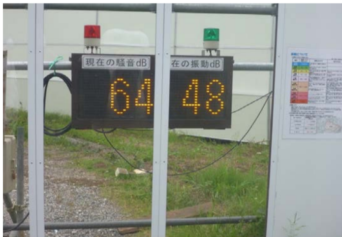
自宅にいと数値以上に揺れを体感する・・・工夫しております