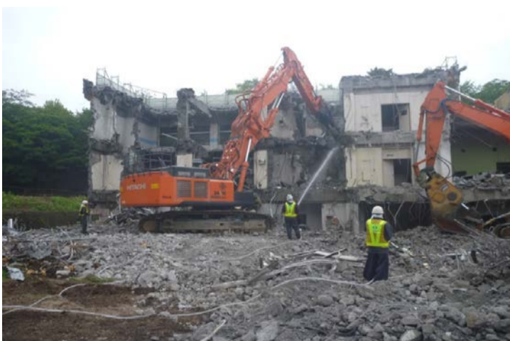
子供センター解体 防塵対策として散水しながら

★子供センター解体時★ 騒音:最大72dB・平均値62dB、振動:最大64dB・平均値53dBでした。