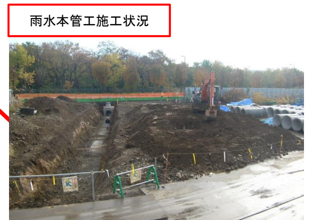
雨水本管工施工状況