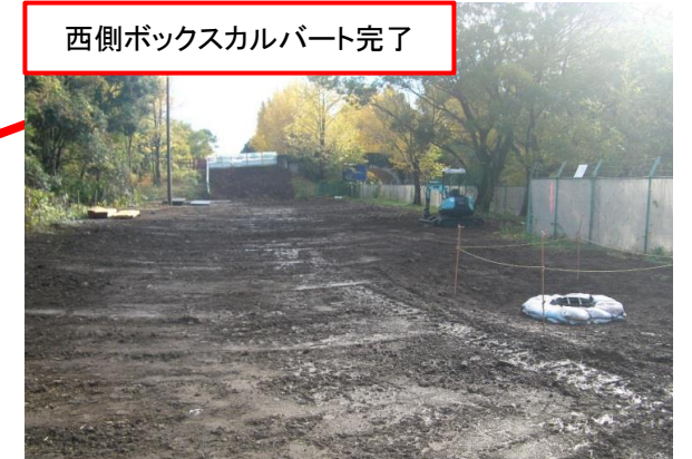
西側ボックスカルバート完了