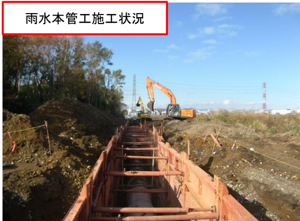
雨水本管工施工状況