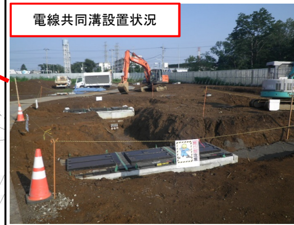
電線共同溝設置状況