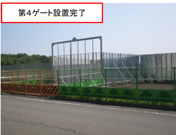
第4ゲート設置完了