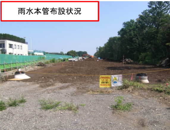
雨水本管布設状況