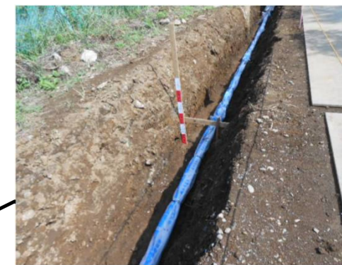
雨水管布設工事(掘削状況)