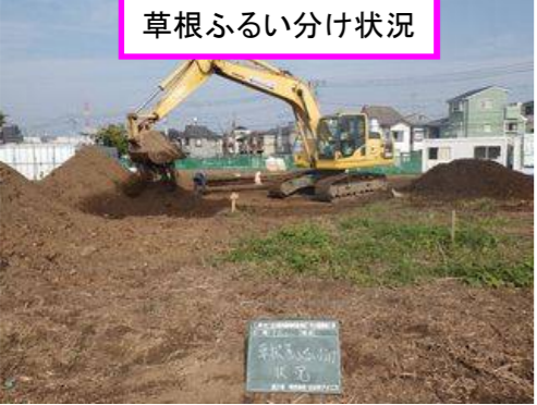
草根ふるい分け状況