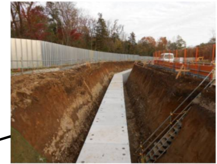
水道管布設(配管状況)