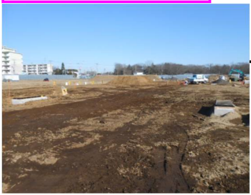
区画道路予定地状況