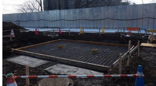
東屋基礎施工状況