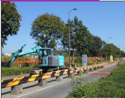
排水工事(常設作業帯)