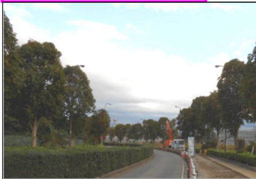
排水工事(常設作業帯)