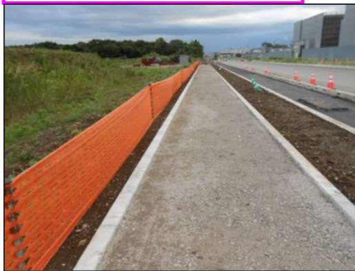
国営公園西線 歩道路盤完成状況