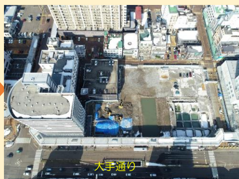
完了(令和3年2月撮影)

4月からは引き続き、新築工事に着手する予定です。皆様には引き続きご迷惑をおかけしますが、ご理解のほどお願い申し上げます。