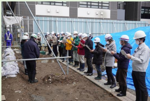
埋蔵文化財発掘調査見学会の様子

大手通坂之上町地区再開発事業地の一部については、かつての長岡城の堀に位置していたことがわかっており、現在、長岡市教育委員会科学博物館によって埋蔵文化財の発掘調査が行われています。