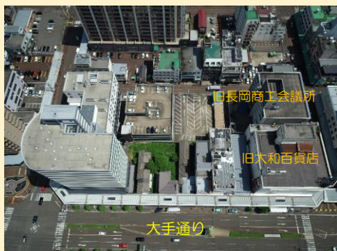
着手時(令和2年6月撮影)

昨年5月から進めてきましたA街区の解体工事が皆様のご理解とご協力により、本年2月末で完了しました。