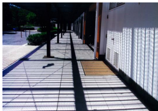
～団地景観 フォト大賞～『プロムナード』 金沢シーサイドタウン並木一丁目第一（神奈川県）