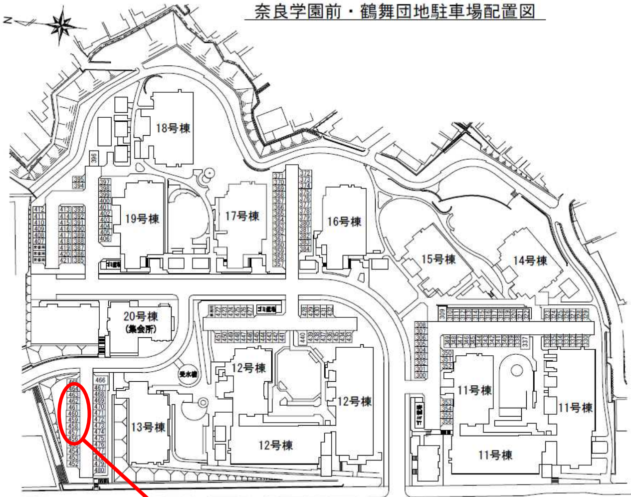
奈良学園前・鶴舞団地駐車場配置図