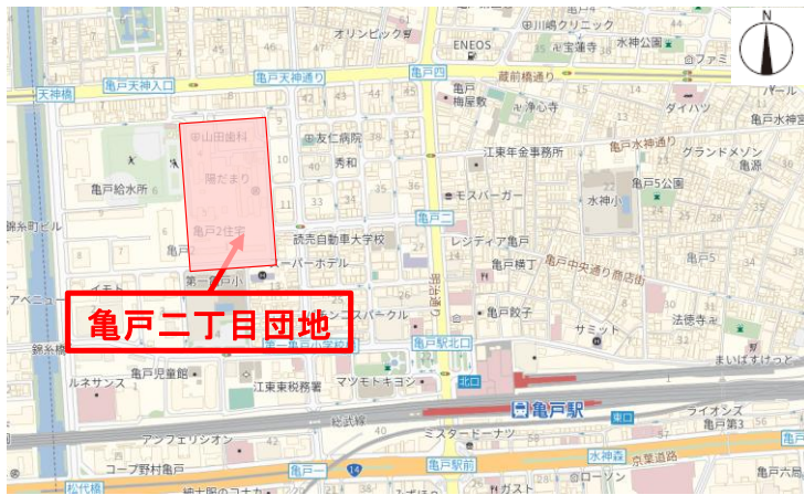
【案内図】 © GeoTechnologies, Inc. 「PL21001」