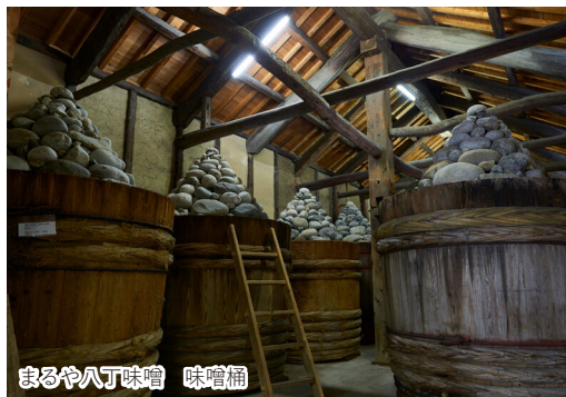
まるや八丁味噌 味噌桶