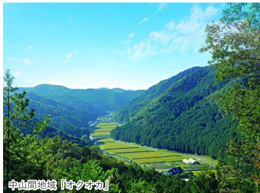
中山間地域「オクオカ」