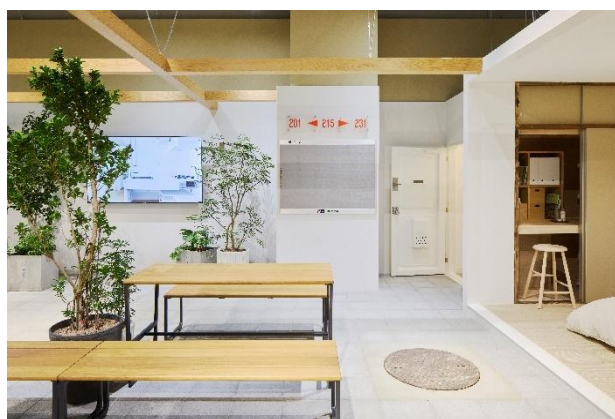
モデルルーム（屋外）