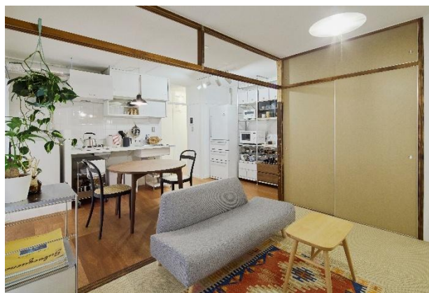
モデルルーム（住戸内）