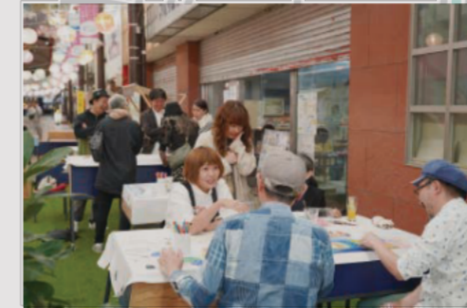
前回のOPEN NUMAZU weekend