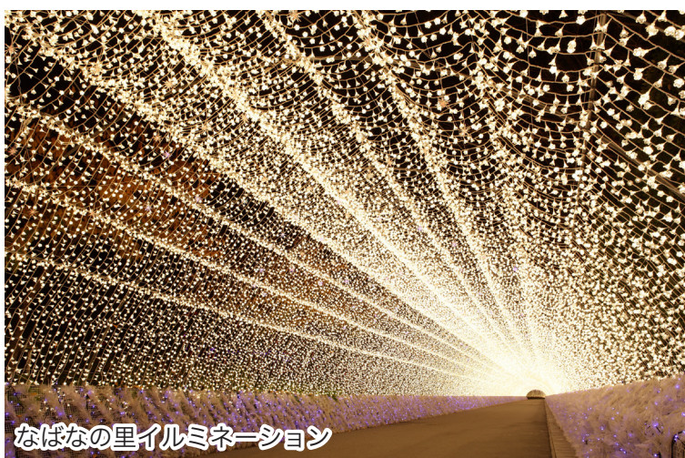
なばなの里イルミネーション