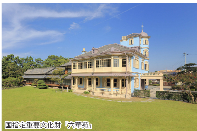
国指定重要文化財「六華苑」