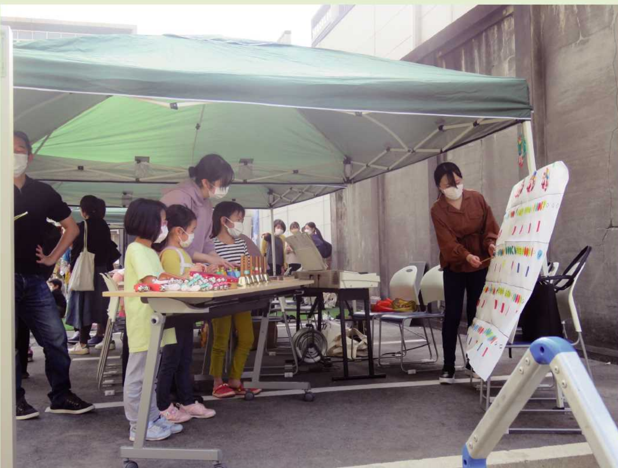
前年度の実証実験 「150mのロジづくり」の様子