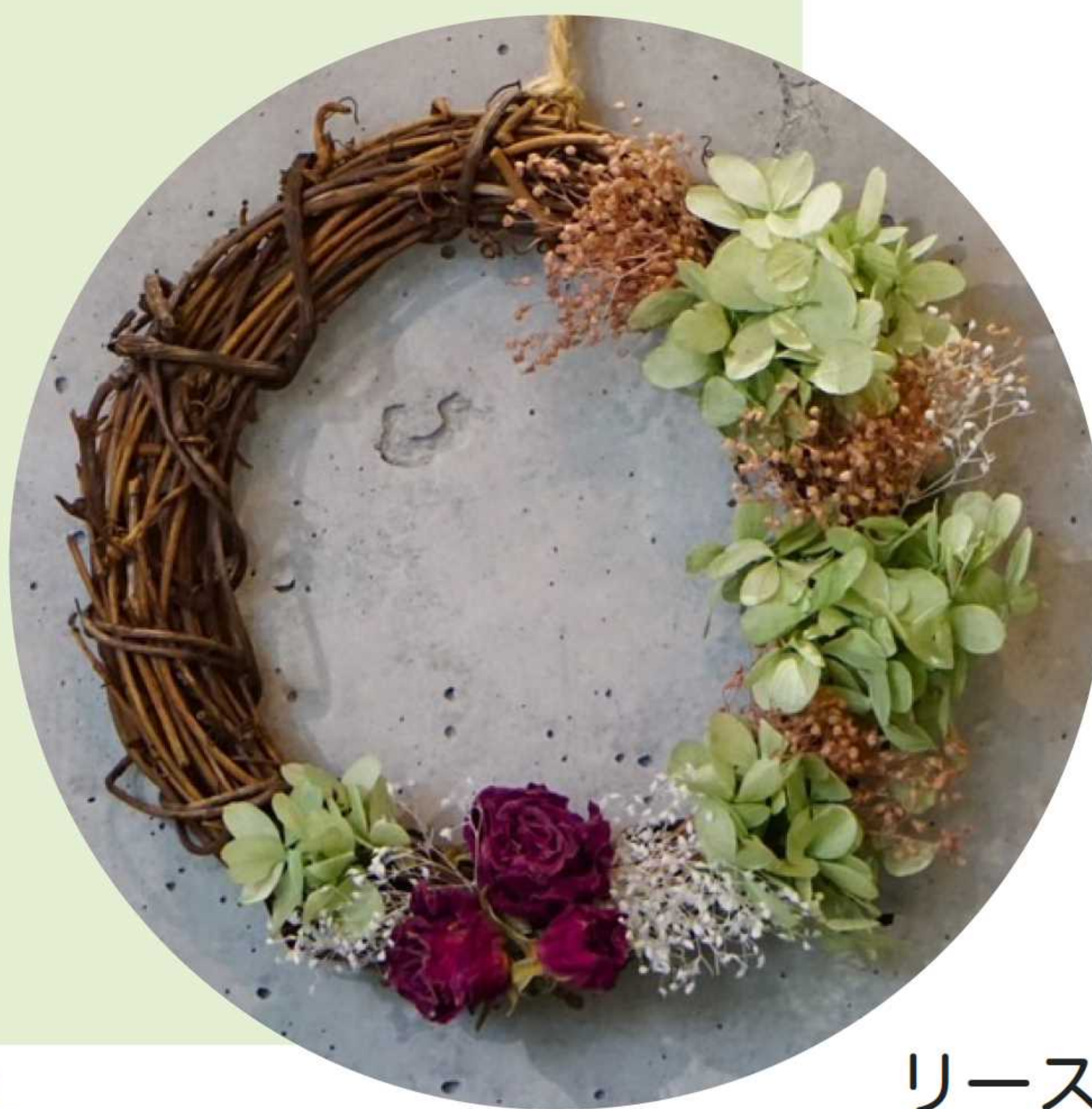
リースワークショップ作品 (イメージ)