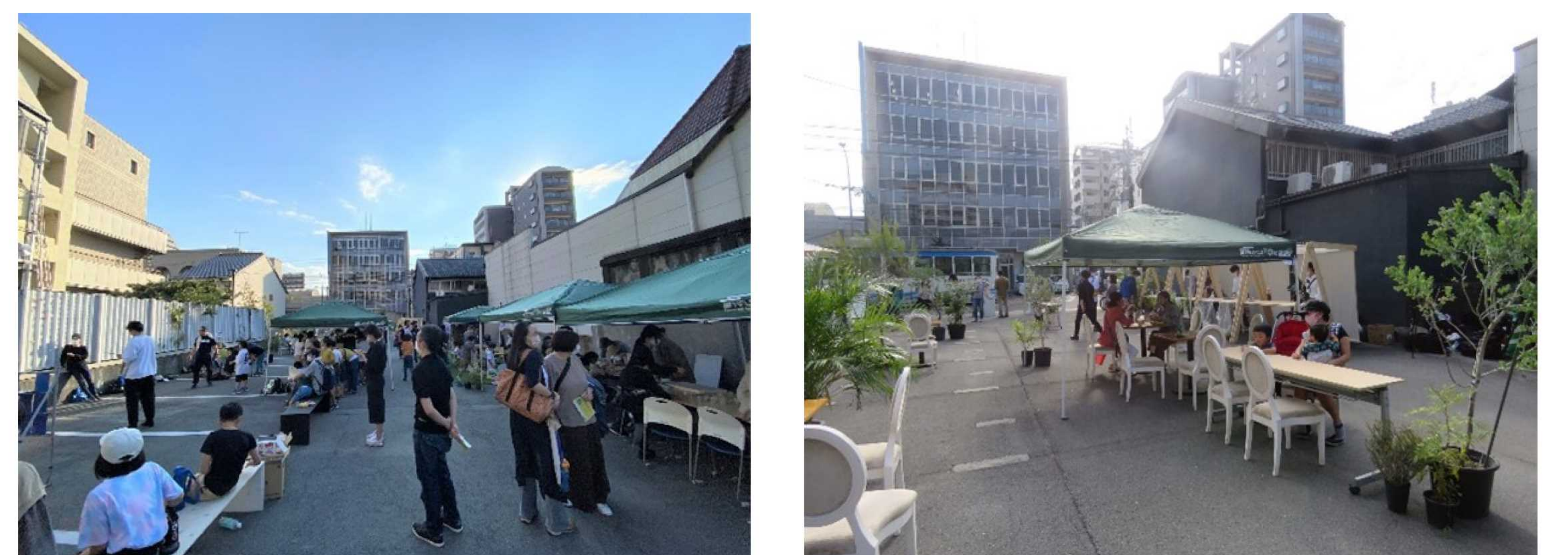
前年度の実証実験の様子

本実験は、くまもと古町実証実験「五感散歩」の一環として、一町一寺の路地や寺社跡・町屋跡にある駐車場等の土地(ロジ)の利活用を図り、古町の個性を維持しつつ、居心地のよい空間を創出することで将来的な豊かな暮らしの実現を目指した取り組みです。