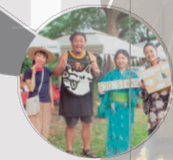
大岡田地 伝馬公園