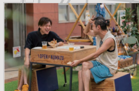
前回のOPEN NUMAZU weekend